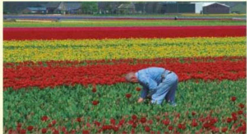
◆ Campesino en Holanda.