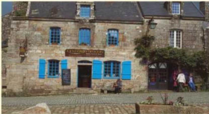
◆ Tienda rural, Francia.