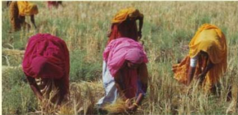
◆ Comunidad rural, India.