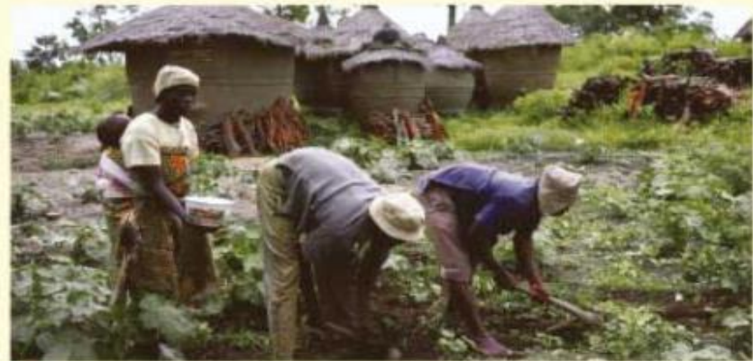
◆ Comunidad rural, Nigeria.