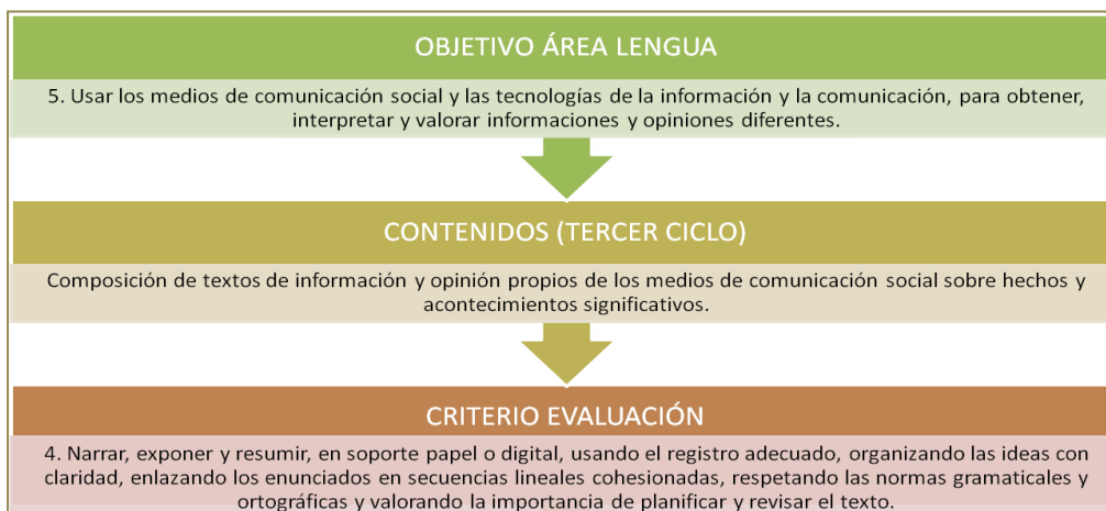
Tabla 3: Ejemplo de asociación de elementos curriculares del área de Lengua en el tercer ciclo de Educación Primaria

Llegados a este punto, en el que se ha establecido en cada área la relación entre objetivos, criterios de evaluación y contenidos, se estaría en disposición de concretar la contribución que cada área hace a cada una de las competencias básicas, y por tanto, se podría asignar a cada competencia los criterios que permitiesen evaluarlas.