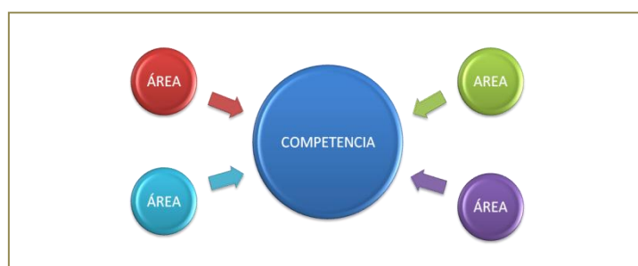
Tabla 1: Definición de las Competencias desde las áreas curriculares

Para dar respuesta al interrogante planteado, ¿cómo se logra evaluar las competencias a partir de los criterios de evaluación establecidos para las distintas áreas?, será necesario, que todas y cada una de las competencias básicas tengan asignados los objetivos, contenidos y criterios de evaluación que contribuyan a su consecución.