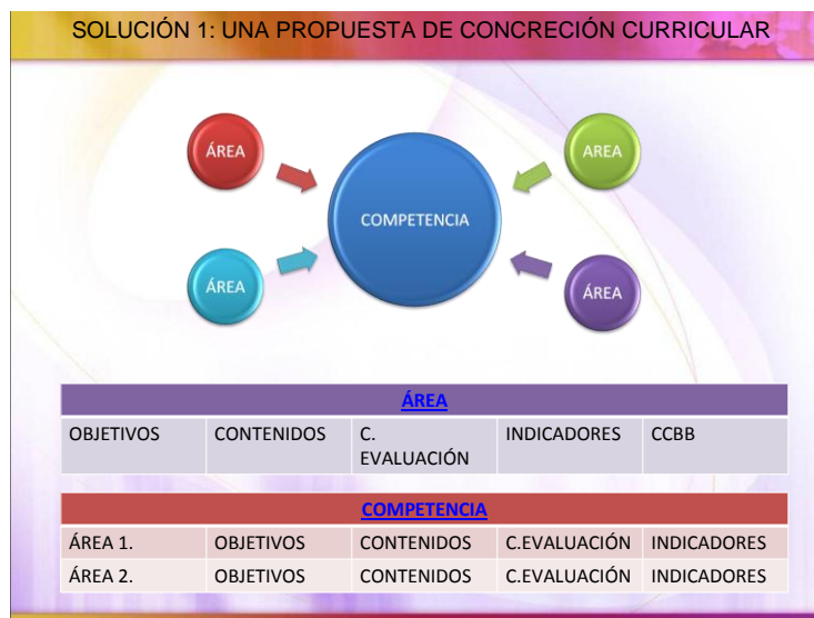
Tabla 5: Propuesta de Concreción Curricular

Una vez finalizado el proceso indicado podremos dotar cada competencia con los elementos curriculares de las distintas áreas. Se habrá elaborado dos documentos de suma importancia, la concreción curricular de cada una de las áreas y la definición operativa de cada una de las competencias, dos documentos claves a la hora de abordar la evaluación.