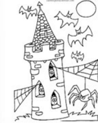
Castillo en Ruinas