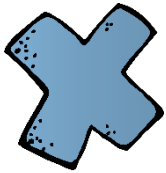
Tabla de multiplicar simplificada