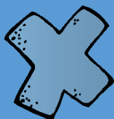
Tabla de multiplicar simplificada